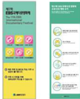
〈EIDF 방역 배너〉