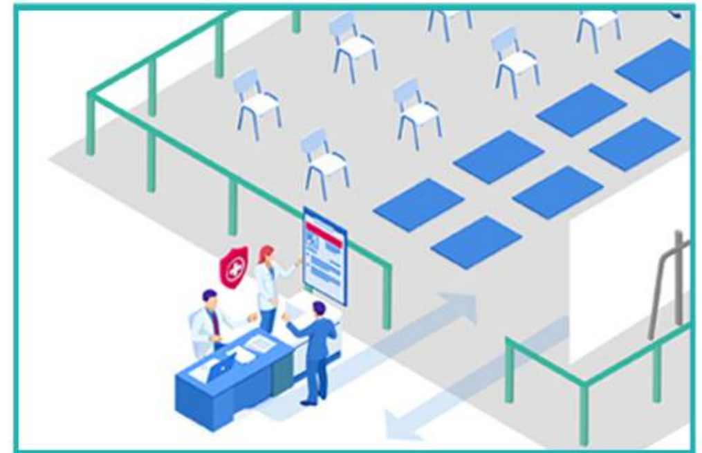
〈EIDF 야외상영 예시 이미지〉