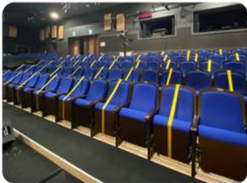
〈EBS스페이스 홀 자리배치〉