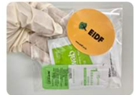
〈EIDF 소독 키트〉